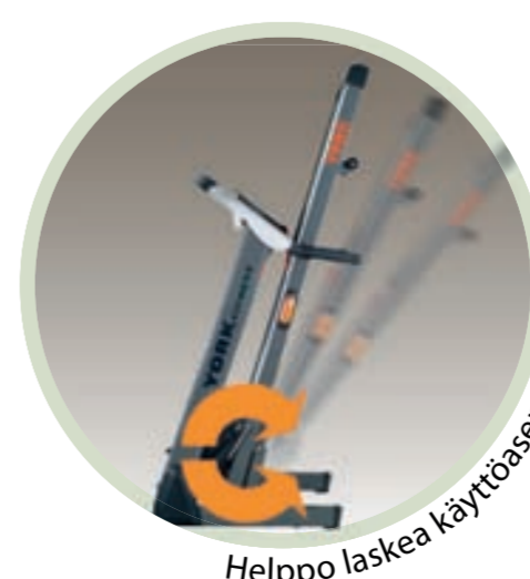
Helppo laskea käyttöasentoon